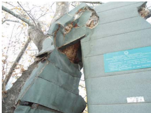
Изглед и состојба на чинарот пред санацијата