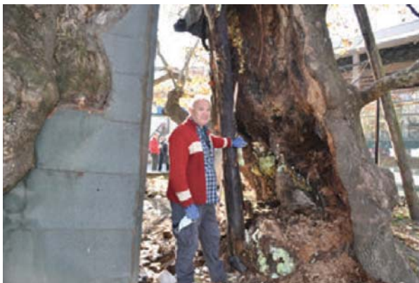
Активности при санацијата на чинарот

Санацијата и ревитализацијата на чинарот се одвиваше целосно според предвидените активности со проектот и договорот. Предвидените мерки и активности целосно се имплементираа на терен, со што чинарот, кој беше доведен до