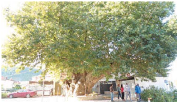
Состојба на чинарот пред санација

Официјални податоци за староста на овој чинар не постојат. Според локалното население, тој потекнува од Османлиската Империја и е стар преку 500 години. За утврдување на староста на чинарот се користеше методата на вадење извртоци од деблото со Преслеров сврдел и броење на годовите, па оттука и податокот дека староста на овој чинар е приближно околу 600 години. Овој чинар е еден од постарите во градот Охрид. Истиот имал големо значење за локалниот живот на граѓаните од ова маало. Бил централно поставен на една поголема раскрсница каде се собирале граѓаните и тука се одвивал јавниот живот на ова маало. Со тоа, културно-историската вредност на овој чинар е голема.