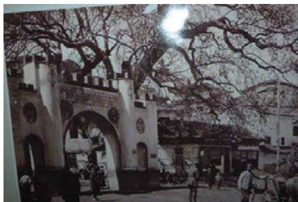
Стариот чинар на плоштадот во Охрид на почетокот на XX век

Тоа е во согласност со начелото за супсидијарност од Законот за животна средина, со што општината има право и должности на своето подрачје да ги преземе сите мерки и активности за заштита и унапредување на животната средина.