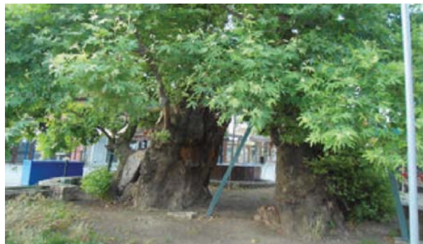
Сегашна состојба на чинарот

Исчистеното дрво хемиски беше третирано со фунгициди, инсектициди и други заштитни средства за импрегнација. Со оваа активност се овозможува активна заштита на дрвото и продолжување на неговиот век. Со кастрење на гранките од поголемиот дел од крошната се намали нејзиниот обим, што понатаму ќе има влијание врз статиката на целото дрво. На одредени места каде кората беше уништена, се постави вештачки направена кора од истиот вид со цел да се запази автентичноста. На дел од стеблото каде природно се појавиле корени, беше направен дрвен сандак наполнет со земја со цел да се заштитат голите корени. Сандакот беше маскиран со вештачка кора направена од природен