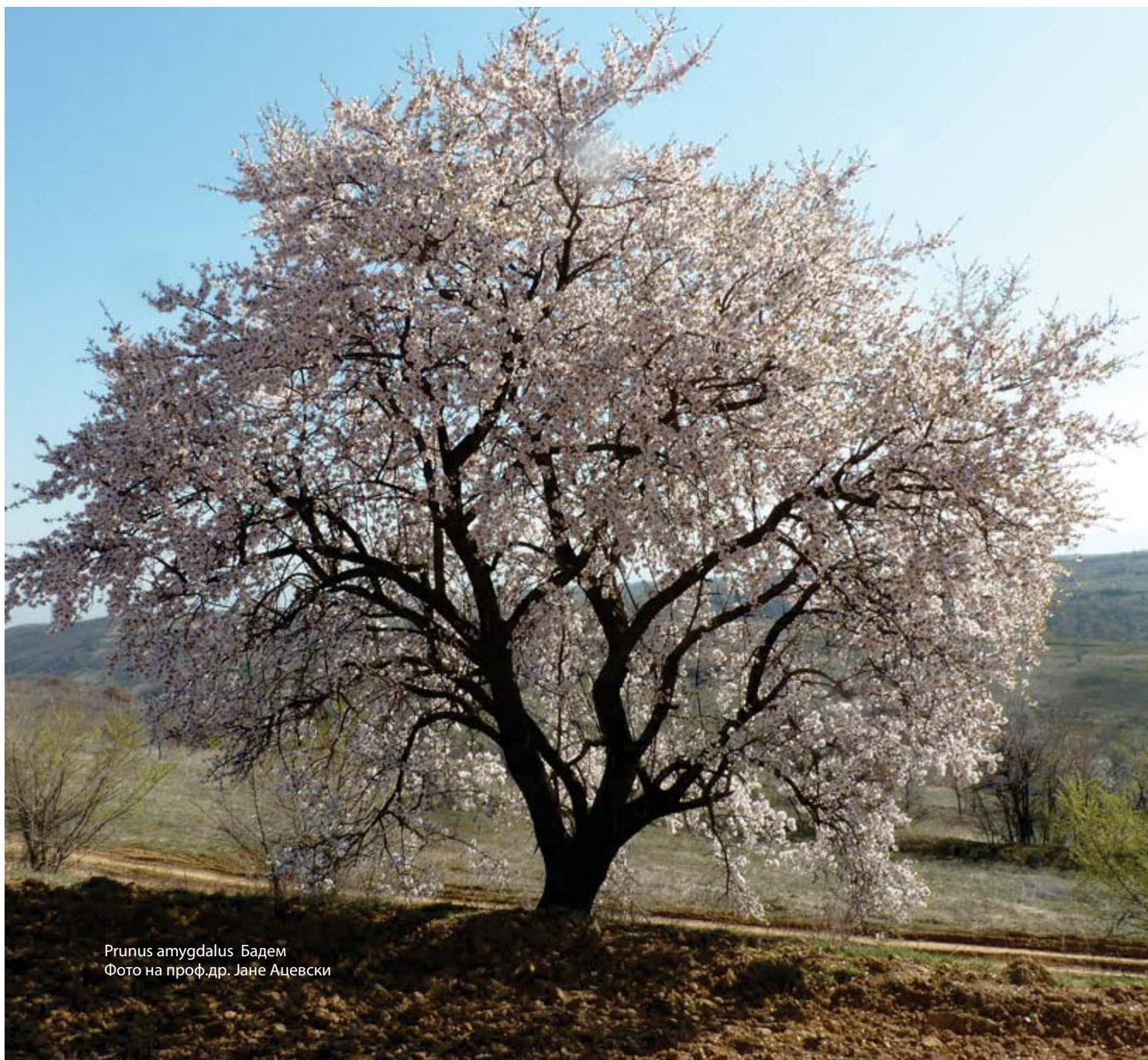
Prunus amygdalus Бадем