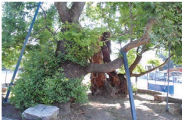
Изглед на чинарот после една година од направената санација

степен на целосно уништување, го врати својот автентичен изглед како што треба да изгледа единаесет века старо стебло. Беа преземени сите потребни мерки за негова механичка потпора со метални столбови, со што би се спречило во иднина да не дојде до кршење на стеблата или поголемите гранки. Целосно беше отстранета претходната заштита направена со шиндра, водоотпорна иверица, пурпена, стиропор, најлон и друг несоодветен материјал, што допринесе дрвото да скапе и да почне да се распаѓа, а во него да се развијат голем број на инсекти и габи. При оваа активност беше отстранета голема количина на отпад и шут. Дрвото кое беше скапано и се распаѓаше, рачно и машински се исчисти до здрава подлога.